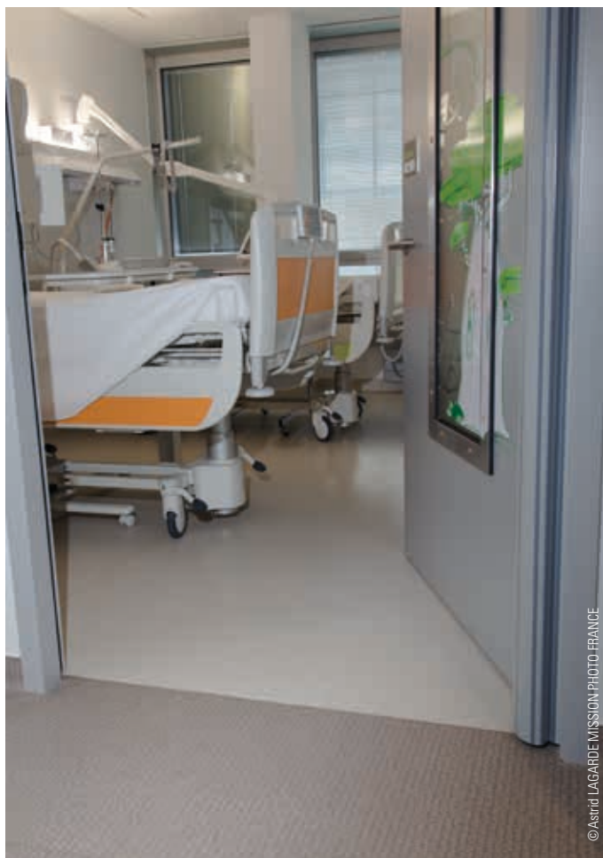
Hôpital Nord Franche-Comté