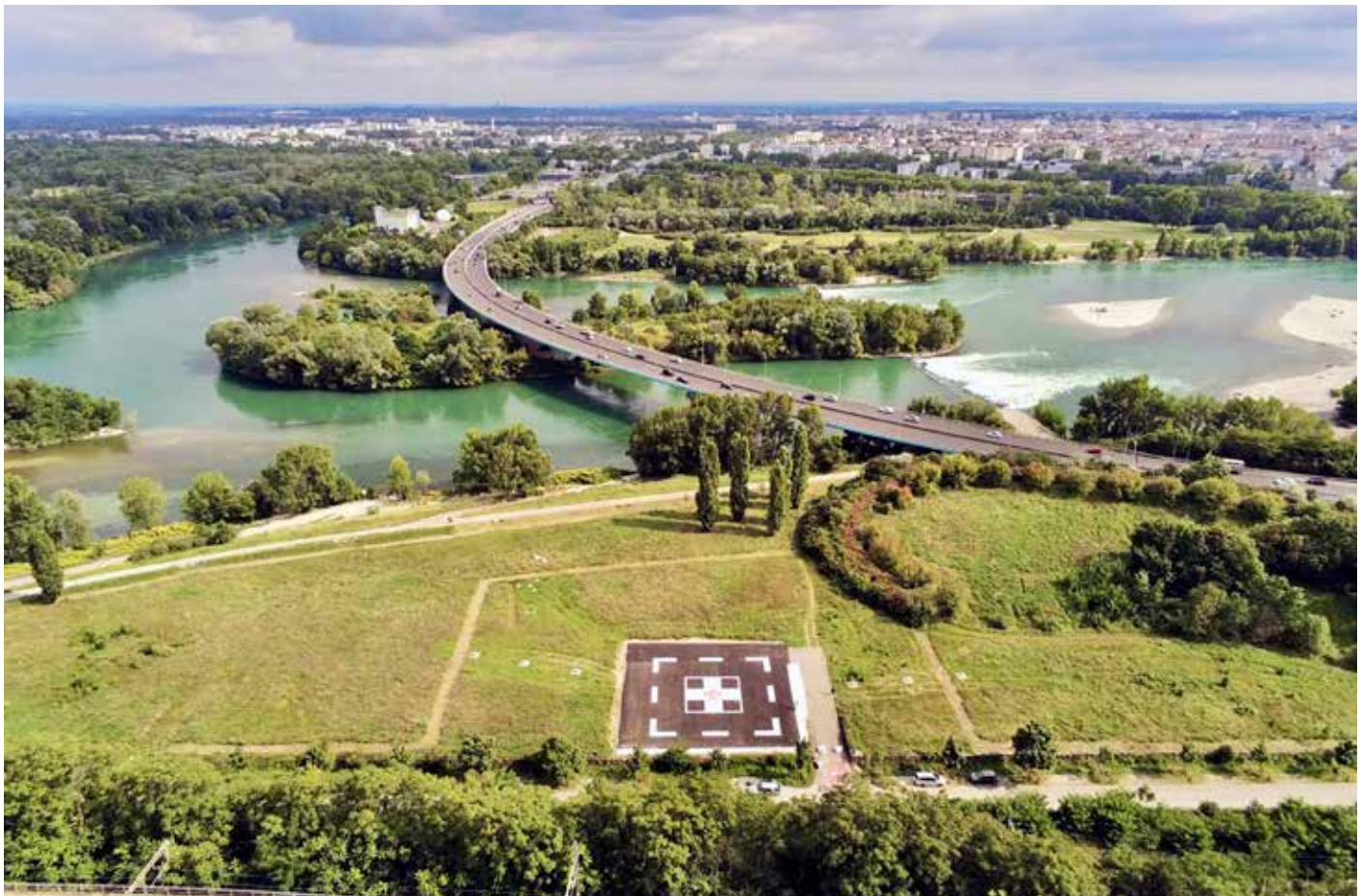
Création d'une hélisurface pour l'Infirmier Protestant en collaboration avec les HCL, la Métropole de Lyon, le Samu 69, la CPTS et la DGAC

Le premier enjeu est bien entendu de conserver la confiance de notre client. Le jour où nous ne serons plus en mesure de répondre à ses attentes, il est évident qu'il pourrait avoir la tentation de solliciter d'autres partenaires. Notre point fort est notre réactivité et l'héritage de notre relation nous permet d'entretenir des échanges constants et d'aller plus vite à l'essentiel. Cette relation semble être très profitable aux deux entités.