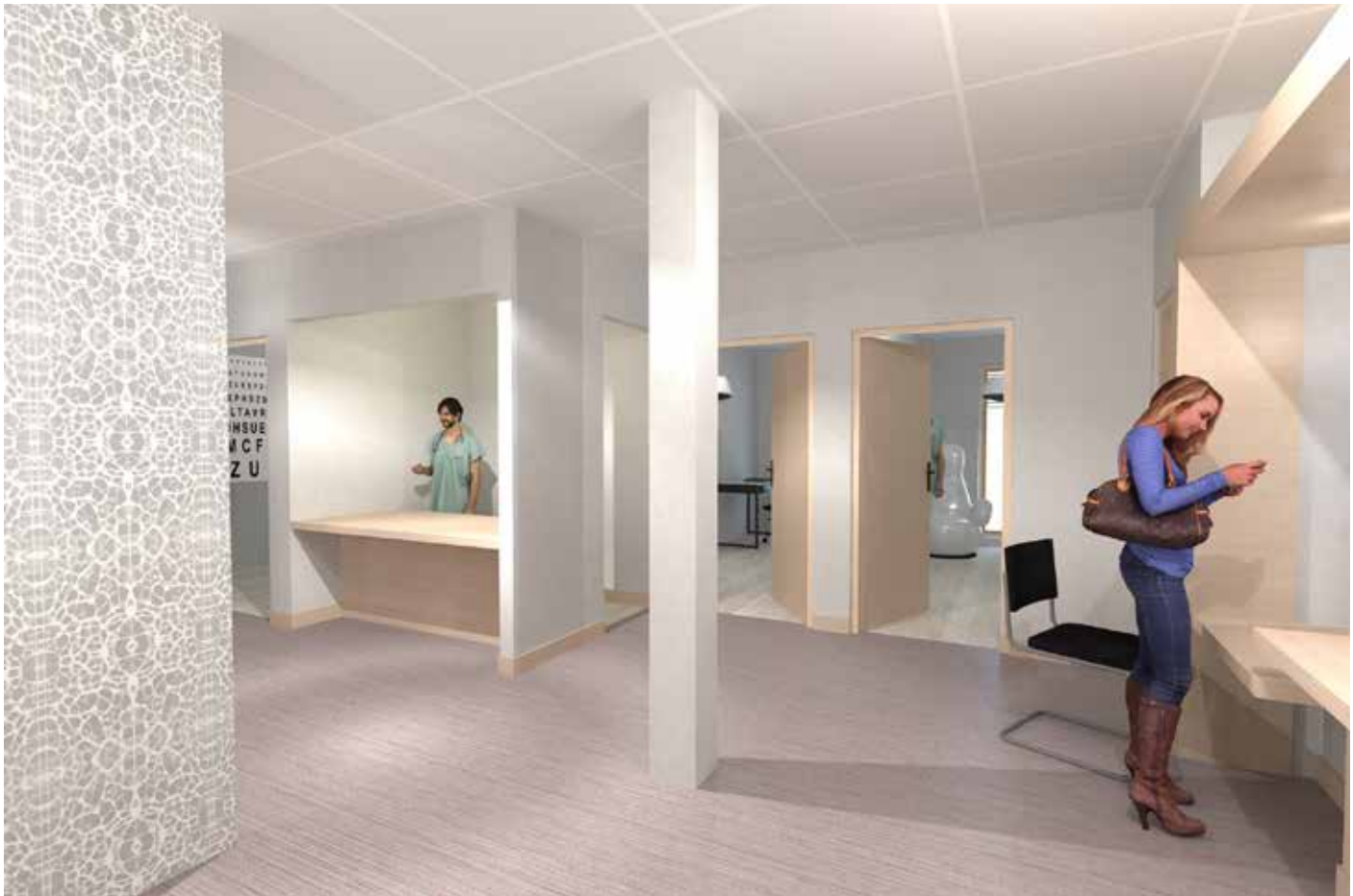
Projet de cabinet ophtalmologique à Francheville (Rhône)