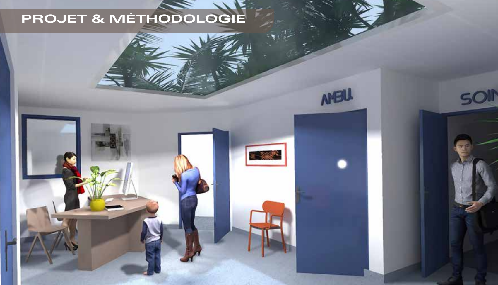
Projet de cabinet de chirurgie esthétique à Horbourg-Whir (Haut-Rhin)