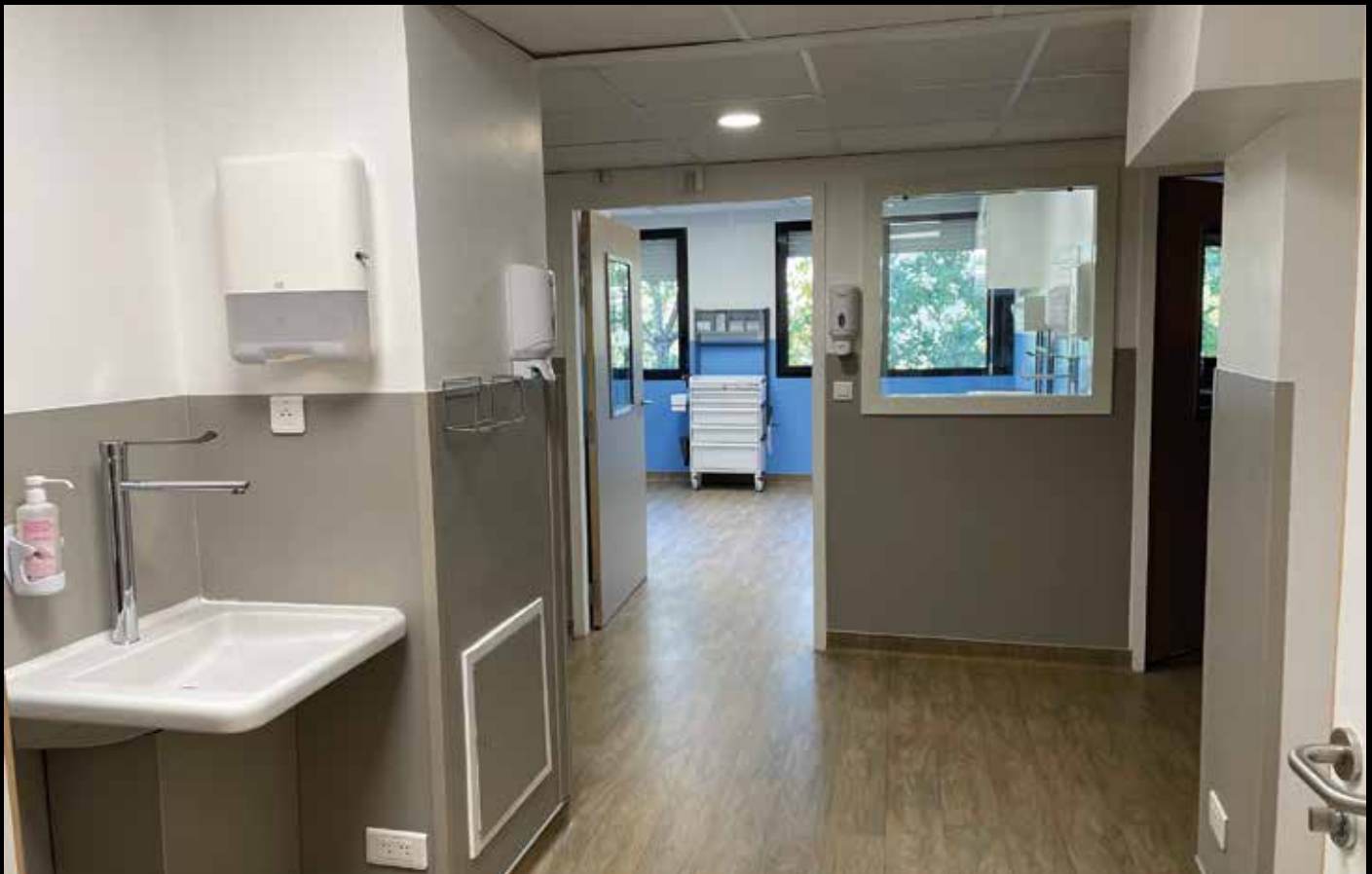
CHU Robert Debré, création des services de Réanimation, Soins Intensifs & Pédiatrie Néonatale