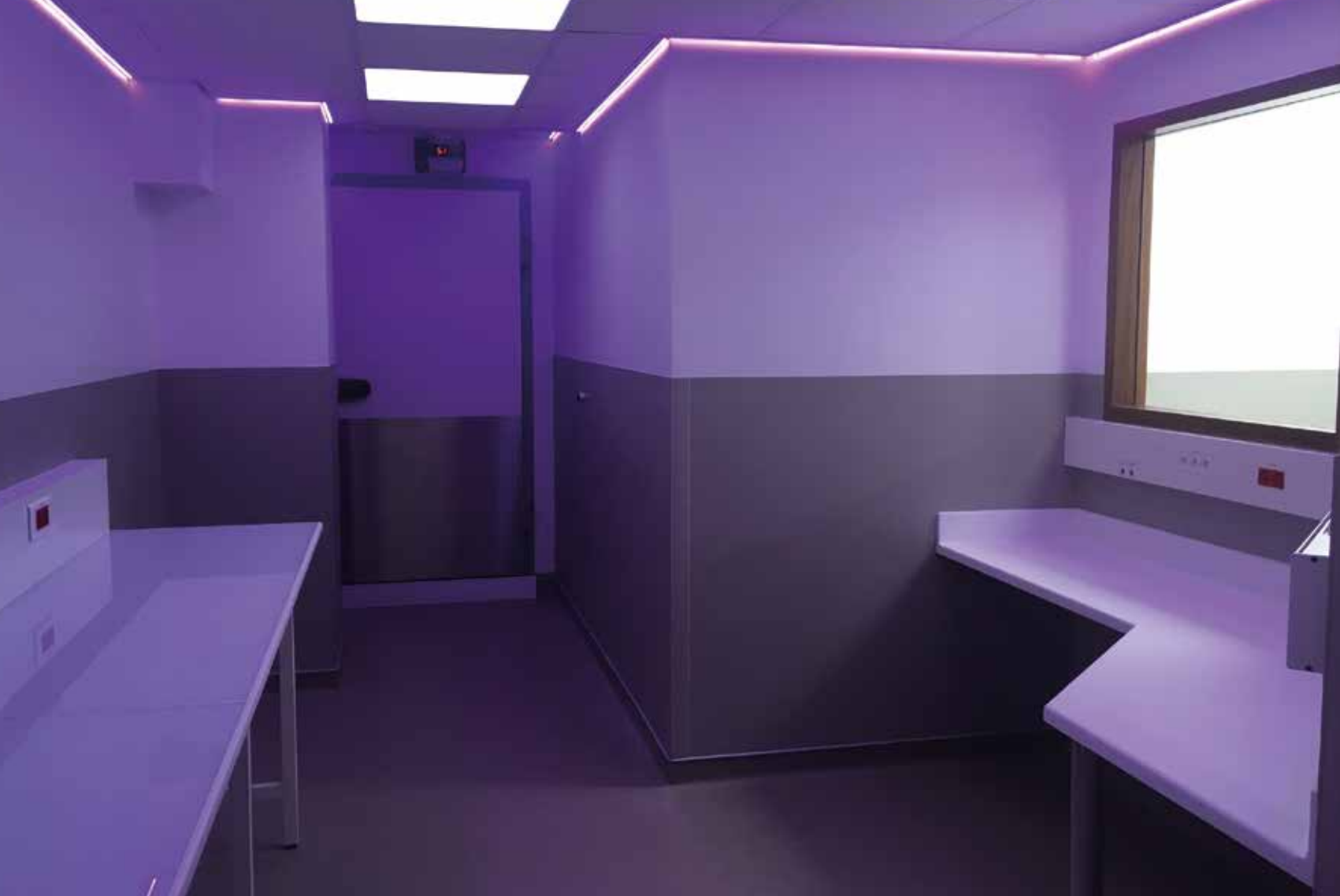
CH Lariboisière, Laboratoire de Biologie Moléculaire