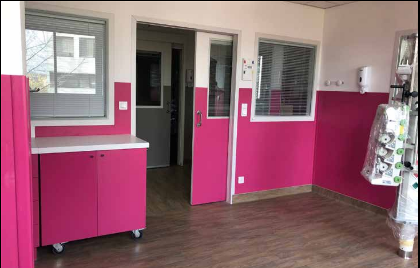
CHU Robert Debré, création des services de Réanimation, Soins Intensifs & Pédiatrie Néonatale