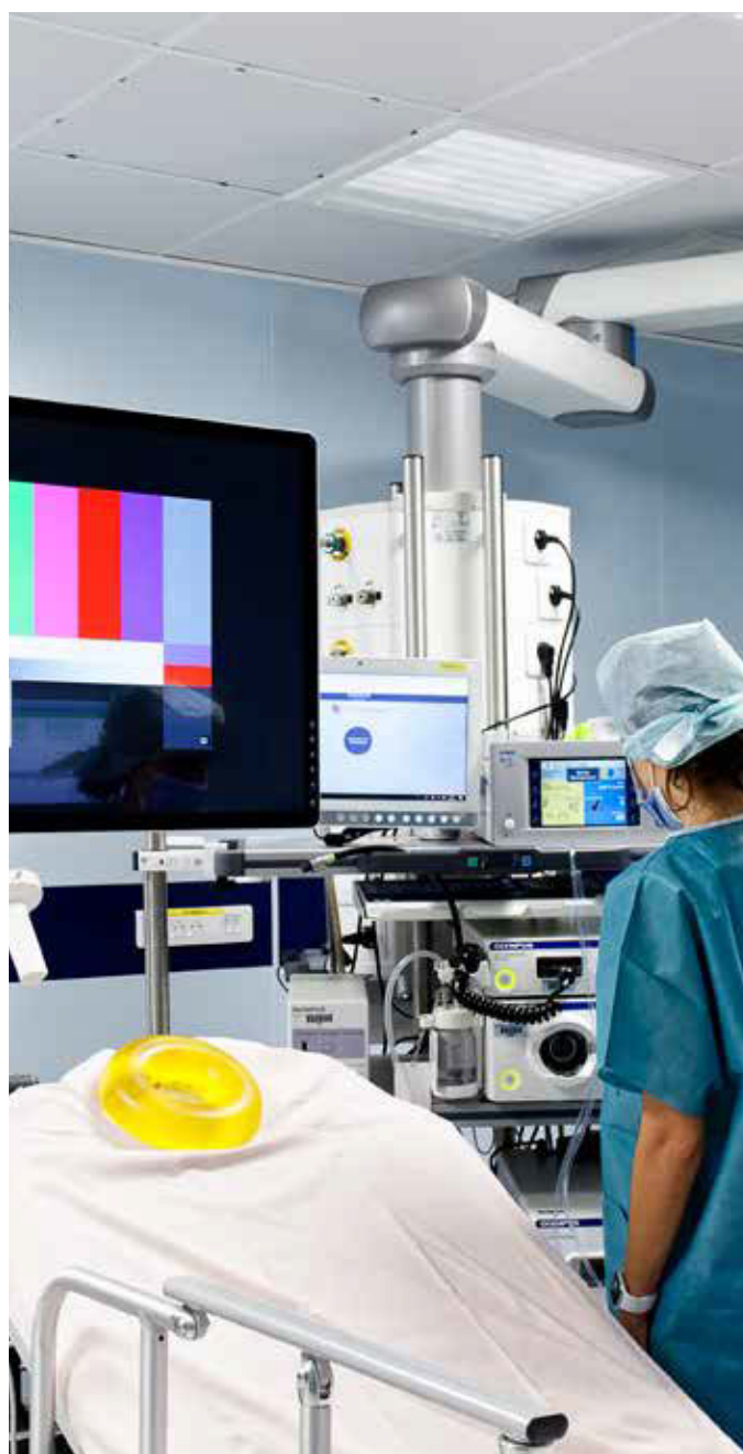
Hôpital Saint-Joseph - Marseille

Dans ces deux exemples, le traitement acoustique permet de réduire la réverbération des ondes sonores, de diminuer la propagation du son et ainsi améliorer l'intelligibilité de la parole. La communication est primordiale à l'hôpital et de ce fait un bon traitement acoustique facilitera les communications entre les personnes pour apporter plus d'efficacité, de sérénité et de confidentialité.