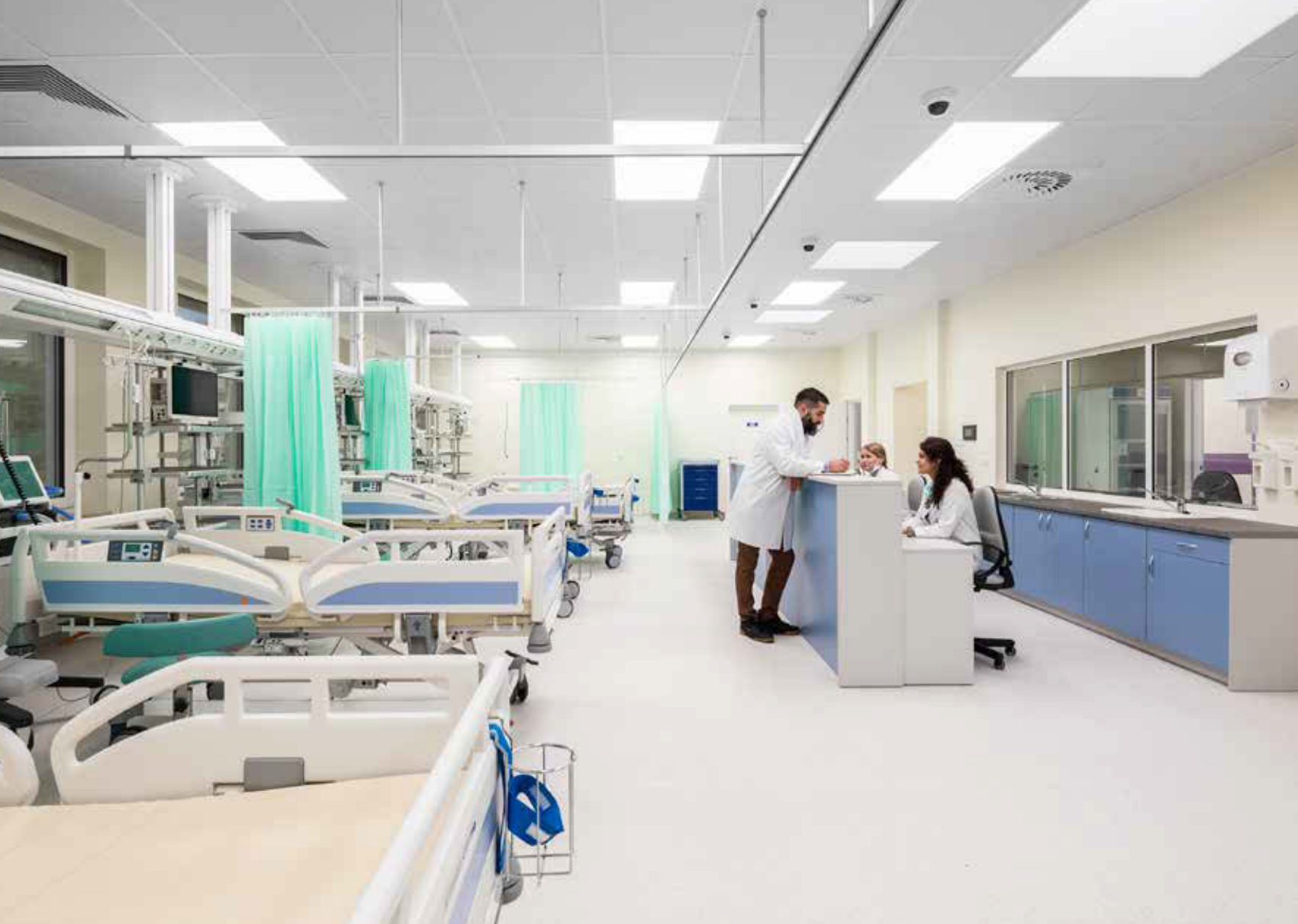
Architecte Zbigniew Degórski