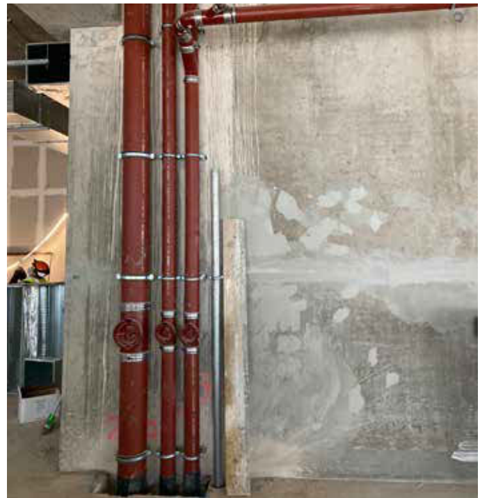
PAM Building - Hôpital de Reims

P. G. : Notre démarche se veut pédagogique car nous souhaitons démontrer que l'hôpital peut être confortable. Il faut apprendre à ne pas raisonner en structures individuelles, mais comprendre l'importance et le rôle de l'ensemble des matériaux présents dans une pièce, afin d'obtenir un ensemble harmonieux et qualitatif. Nos entités industrielles et de la distribution sont très actives dans le domaine hospitalier. Nous utilisons de nouveaux outils pédagogiques tels que la réalité virtuelle afin de mieux sensibiliser les acteurs du secteur hospitalier sur l'importance du choix des matériaux et de leurs impacts dans notre vie et notre usage quotidien. Nous pouvons ainsi proposer des solutions qui répondent aux besoins spécifiques de chaque lieu. Saint-Gobain s'efforce de créer des espaces de vie qui auront un impact sur le comportement et le bien-être des patients et du personnel de santé. En effet, cette notion est fondamentale pour la guérison du patient ainsi que pour le moral des soignants.