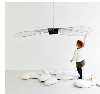
Constance Guisset © Constance Guisset Studio