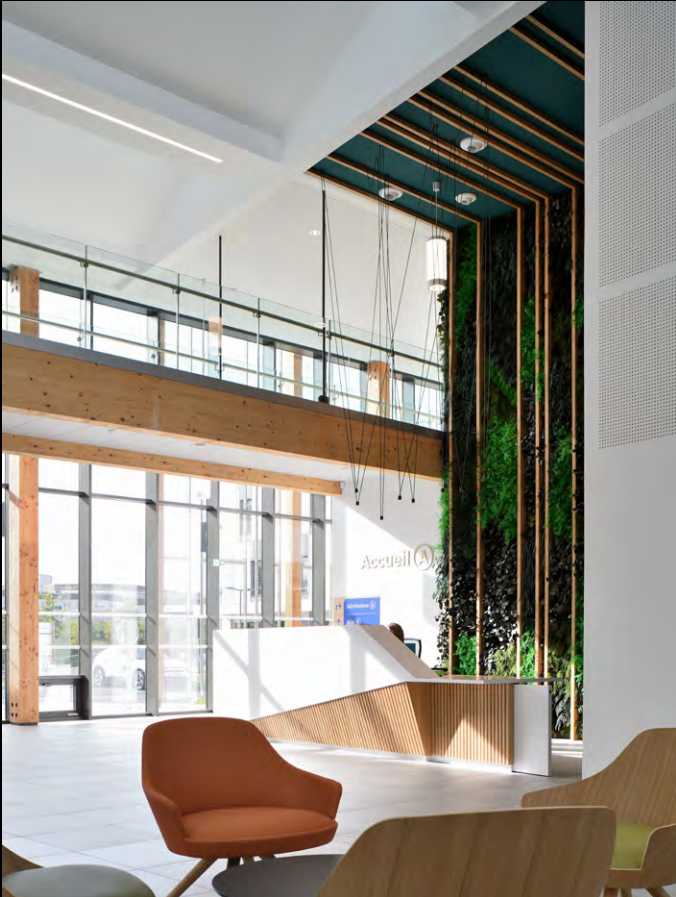
Centre Jean Bernard