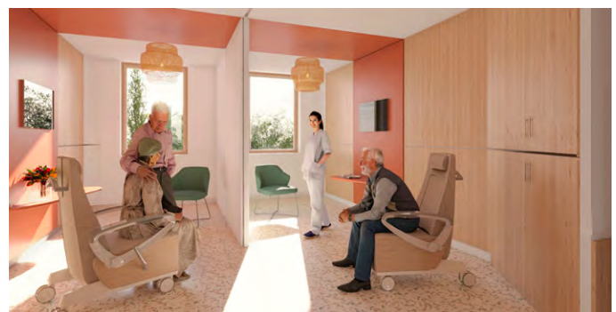
Oncopole de Charleville-Mézières © Chabanne Architecte