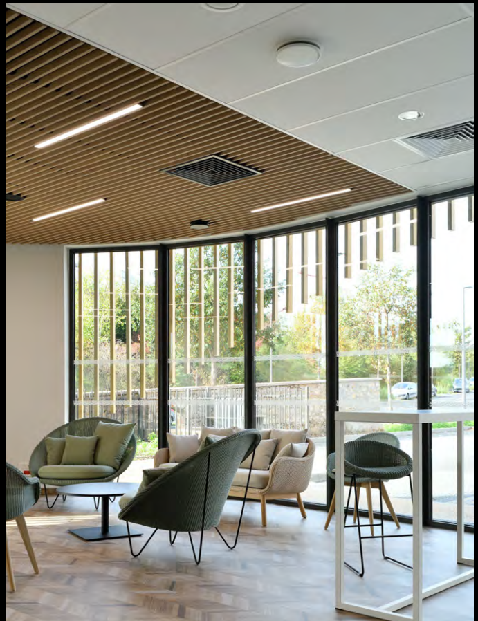
Centre Jean Bernard