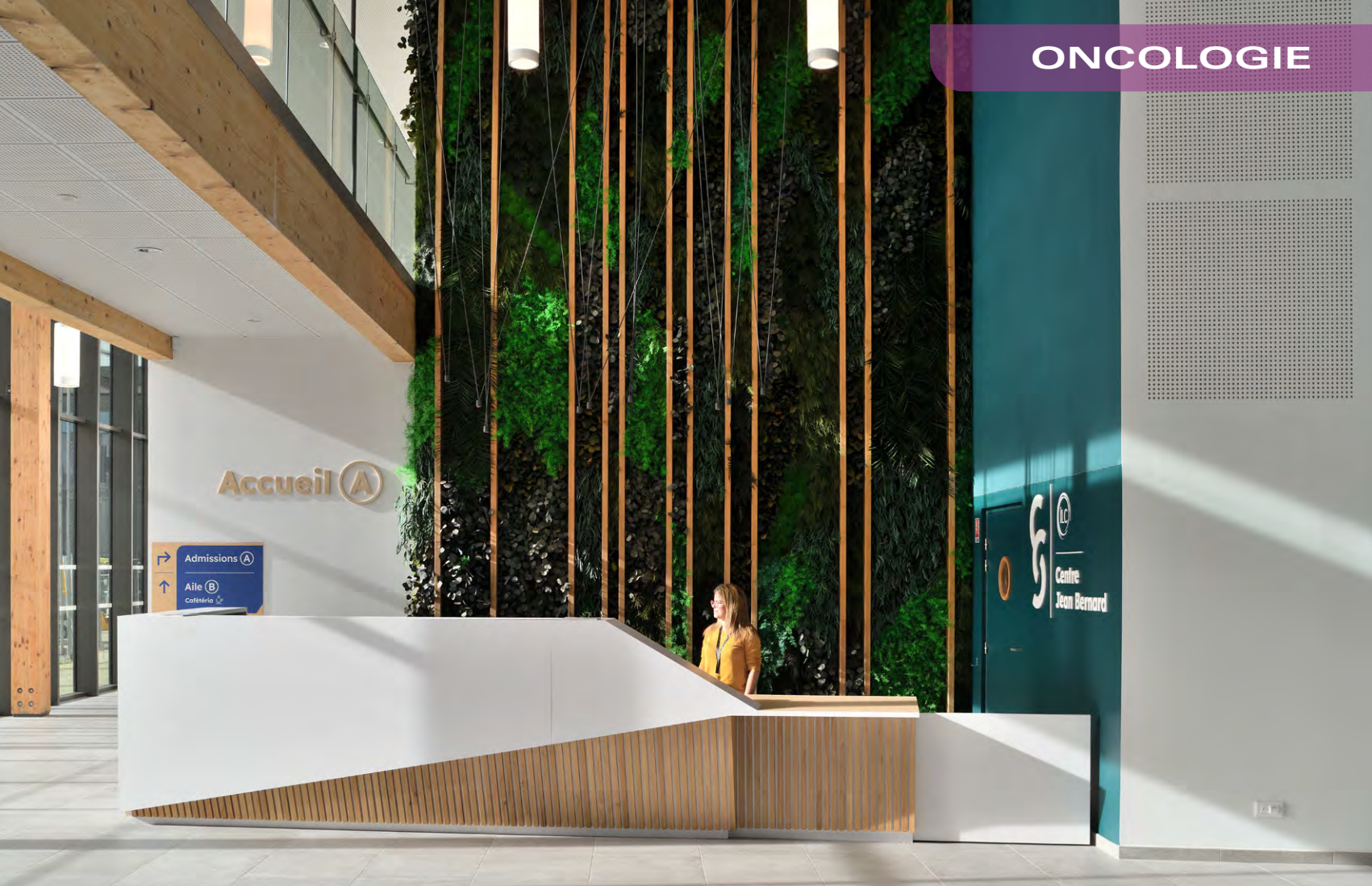
Centre Jean Bernard du Centre de Cancérologie de la Sarthe