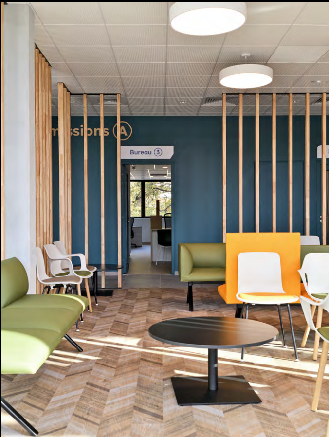
Centre Jean Bernard