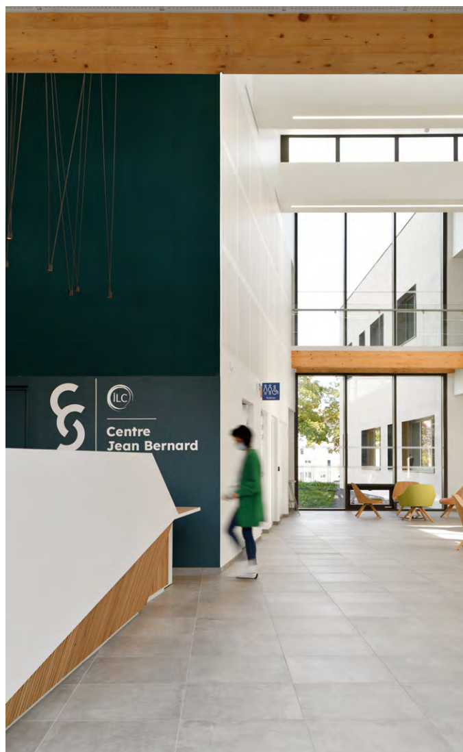
Centre Jean Bernard