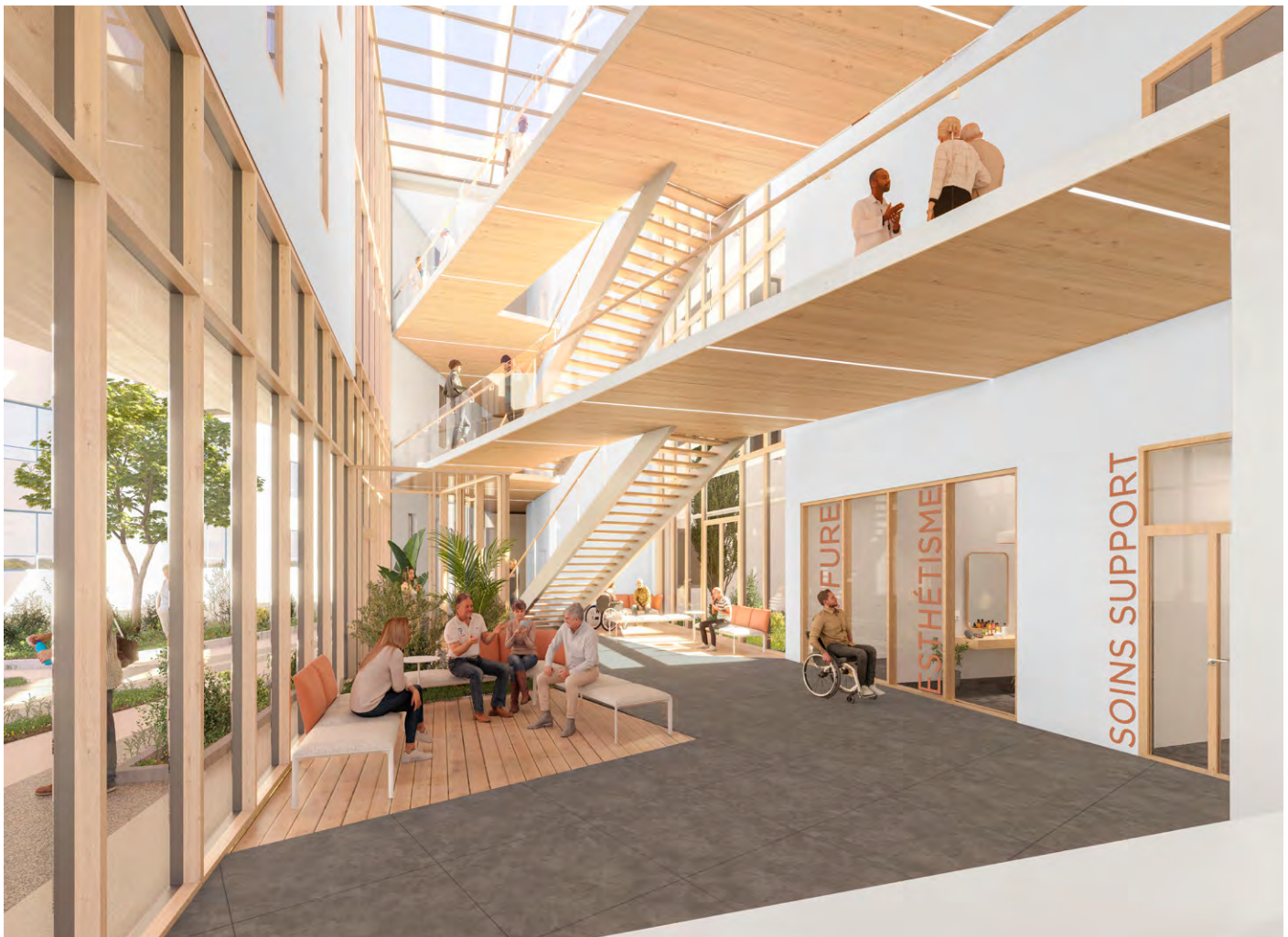
Oncopole de Charleville-Mézières © Chabanne Architecte

Enfin, dernier enjeu, ce projet doit permettre de renforcer l'attractivité de l'établissement pour recruter du personnel. L'attractivité et la fonctionnalité de l'équipement de travail sont en effet essentielles !