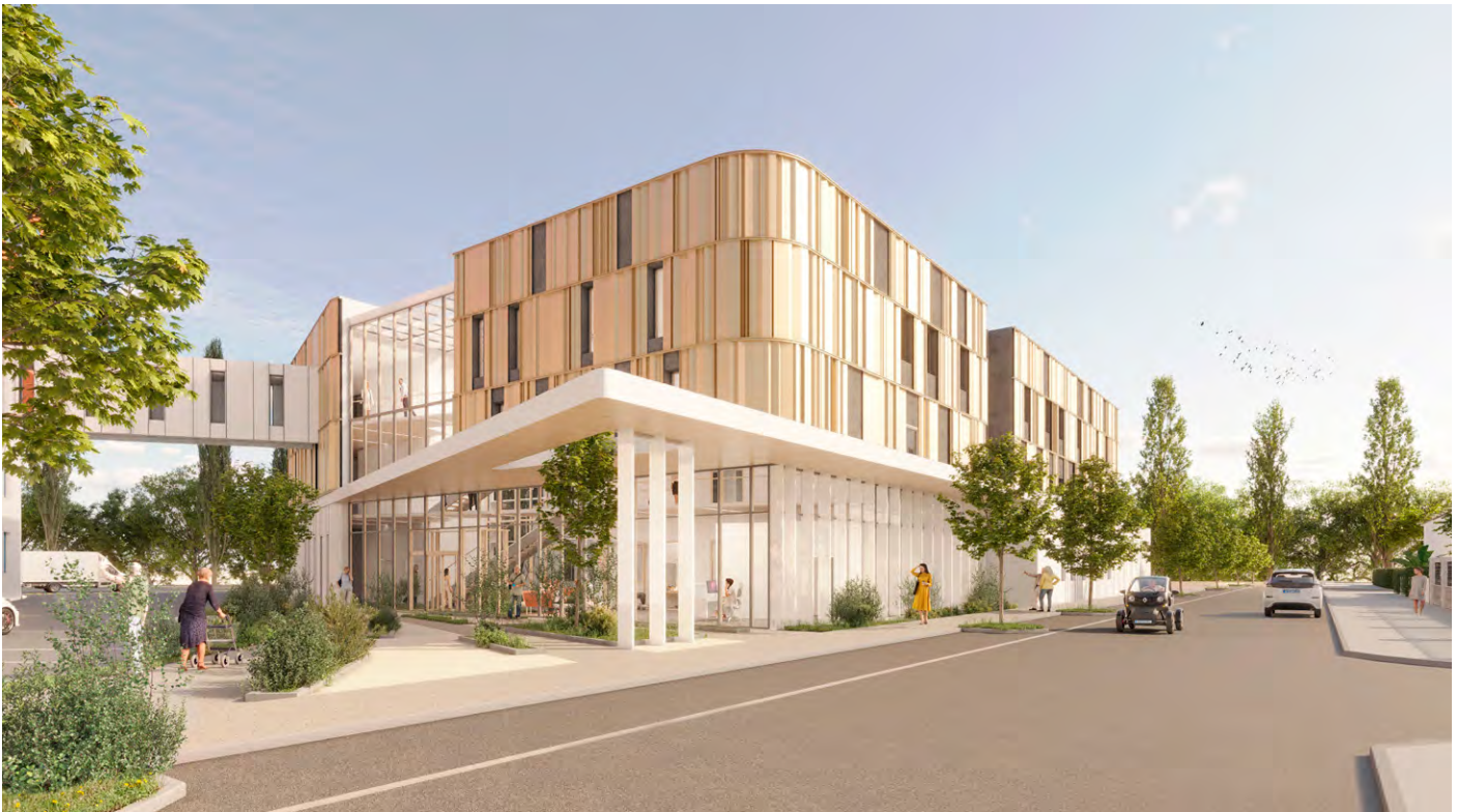
Oncopole de Charleville-Mézières © Chabanne Architecte