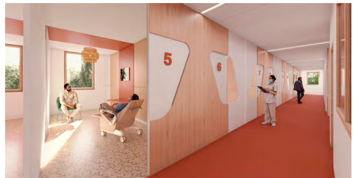
Oncopole de Charleville-Mézières © Chabanne Architecte

Nous n'avons pas de rencontre directe avec les patients. Cependant, il existe des associations qui sont composées d'anciens patients ou de leurs familles, et ce sont elles qui jouent un rôle en recueillant et transmettant les besoins identifiés durant certaines hospitalisations. Nos échanges avec ces associations sont précieux, car leur perspective est centrée sur le patient.