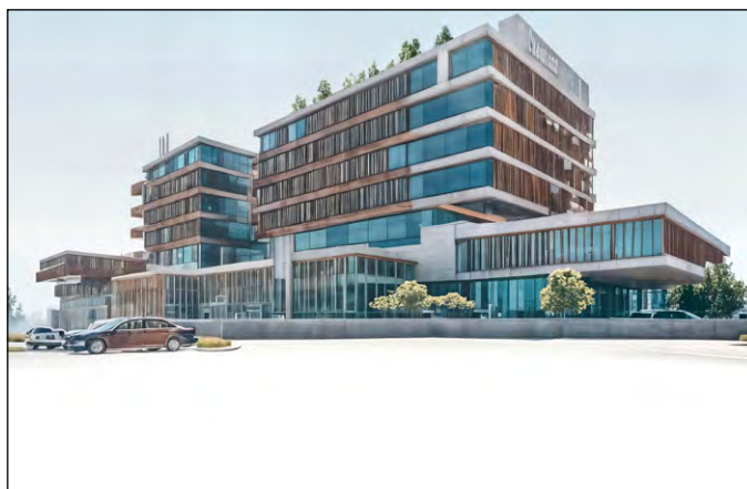
Séquence IA 2