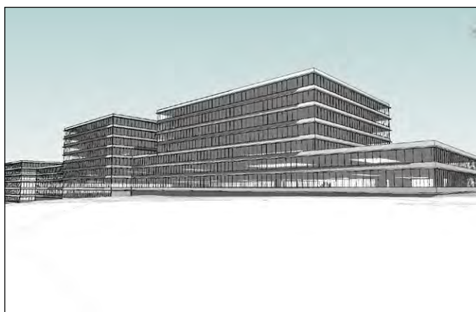
Séquence IA 1

S. B. : L'hôpital de demain sera centré sur le parcours patient, l'efficacité et la qualité spatiale, qui sont déjà des éléments clés aujourd'hui. Ce parcours, directement lié à l'évolution des pratiques médicales, continuera de se transformer. Nous constatons depuis des années déjà l'essor de l'ambulatoire, et, demain, d'autres pratiques émergeront. L'objectif sera de créer des espaces qui facilitent ce parcours tout en offrant un confort optimal, que ce soit pour les patients ou pour le personnel soignant. L'hôpital de demain sera esthétiquement agréable, efficace et respectueux de l'environnement. Il intégrera des technologies avancées pour optimiser les flux de patients et réduire les temps d'attente. Cependant, l'essentiel restera de créer un lieu où les personnes se sentent bien, où elles oublient presque qu'elles se trouvent dans un hôpital. Ce sera un lieu qui combine confort hôtelier, beauté architecturale et performance médicale. Cela nécessitera une collaboration continue entre les équipes médicales, les architectes et les technologies comme l'IA pour anticiper et répondre aux besoins des hôpitaux du futur.