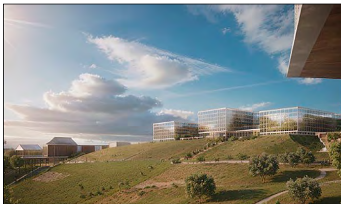
Séquence IA 4